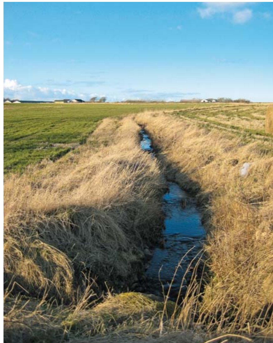
Mange af vandløbene i det åbne land er i en dårlig stand Billedet er taget øst for Fabjerg Kirke.

I de egentlige ådale etableres våde enge. Der bør etableres adskillige grus/gydebunker i vandløbene. Eksisterende læhegn forlænges og beplantninger (remisser) etableres f.eks. i skæve hjørner. I de tidligere grusgrave bør der sikres lettere offentlig adgang.