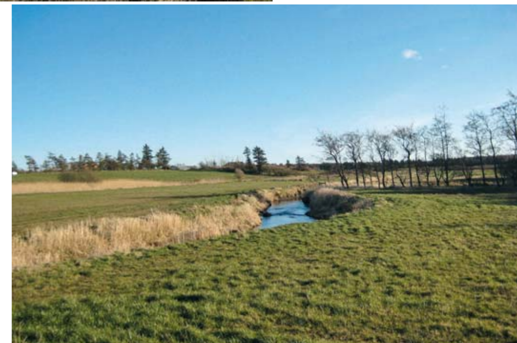
En sammenhængende eng langs Flynder Å vil virke som en spredningskorridor.