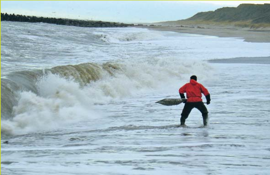
Ravfisker ved Bovbjerg.