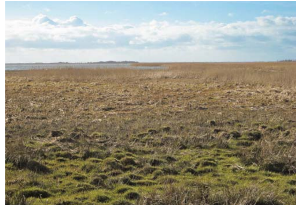
Rørskoven omkring Bøvling Fjord (her Indfjorden) bør holdes i skak.

hjælpe på tilgængeligheden og på naturoplevelserne gennem et bedre udsyn. Endelig vil en fortsat skovrejsning med blandet skov i området omkring Nees Hede også give mulighed for større naturoplevelser.