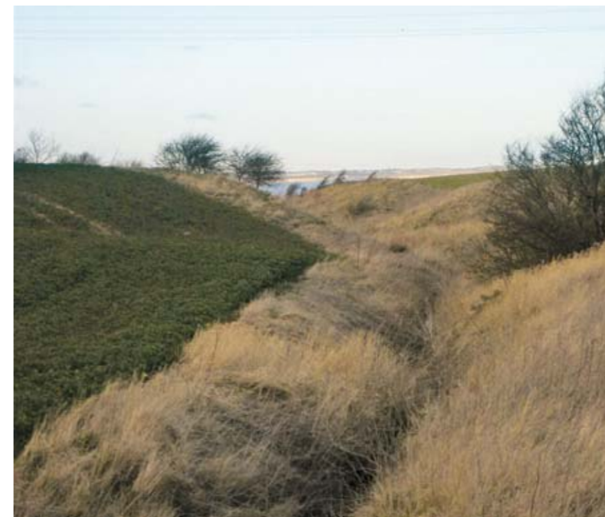
De dybe, flotte slugter ned mod Nissum Bredning er spændende for dyr og mennesker.

Træborgdalen skal sikres og udvikles som den naturperle den er. I området mellem Nissumvej og Struervej bør der værnes om træbevokninger på skrænter, ligesom tilbageværende vandhuller og rester af moser bør vedligeholdes/udvides.