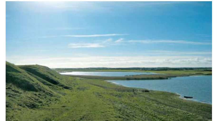
Veserne er et storslået vådområde. Varierende vandstand kræver vedligeholdelse af adgangsvejene.

Harboøre Tanges strandene skal bevares og vedligeholdes gennem tilstrækkelig afgræsning af hensyn til fuglelivet. Det samme gælder for strandene ned til Gjellerodde. Engene langs veserne ned til Ferring Sø skal gøres mere tilgængelige for publikum. De laveste arealer af Vestersø kan let gøres til våd eng, men det ville være oplagt at genskabe hele Vestersø ved naturgenopretning. Herved opfyldes også krav til reduktion af næringsudledning. Desuden vil området sammen med det nuværende Gjellersø/-odde område kunne danne et stort sammenhængende naturområde tæt på "fritidsområderne".