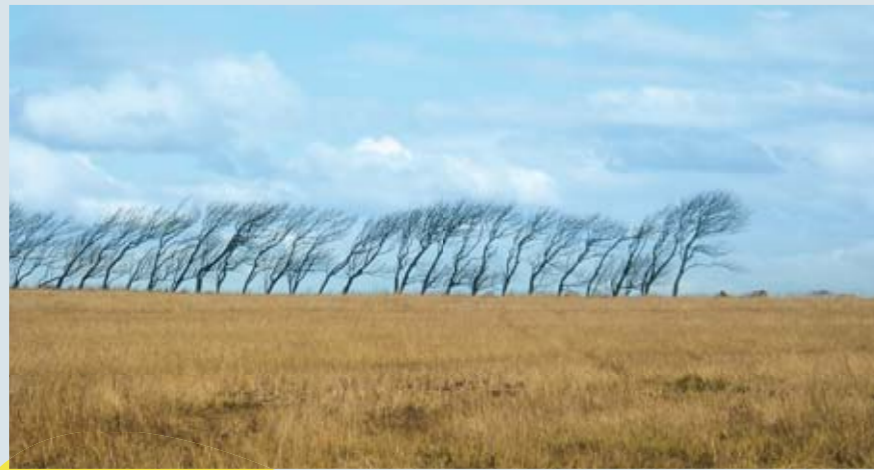
Læhegn ved Fabjerg.

Danmarks Naturfredningsforening Tlf. 39 17 40 00 dn@dn.dk